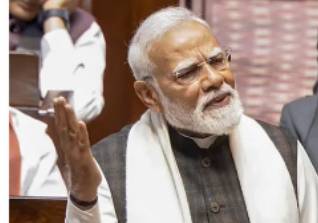
భారత్ వరసతి పెరుగుతోంది..

అక్షరమార్పులను రక్షించేందుకు బెంగాల్ ప్రభుత్వం కోర్టును ఆశ్రయిస్తోంది. అభివృద్ధి చెందిన దేశాలు కూడా ఆక్షరమ వలసదారులను బయటకు పంపించివేస్తున్నాయి. బెంగాల్ లో మాత్రం అటువంటి వారిని రక్షించే ప్రయత్నం చేస్తున్నారు. దేశ ప్రజల హక్కులు హరిస్తున్నాం" అని ప్రధాని మోదీ పేర్కొన్నారు.